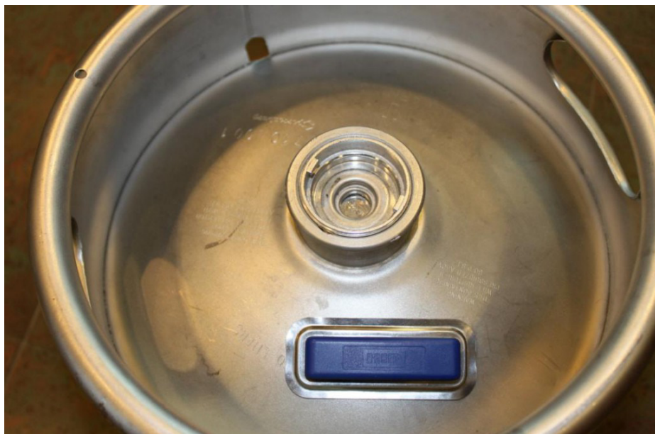
EPC/RFID таг на пивско буре